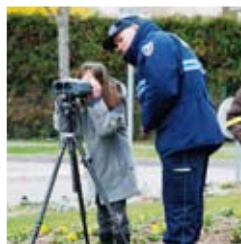
Journée de la Courtoisie