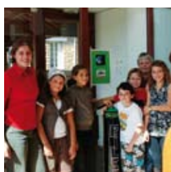
Bilan d'activités des services