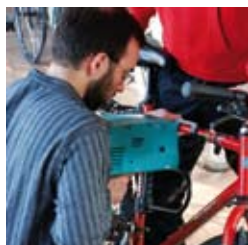
Marquage des Vélos