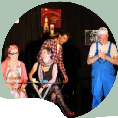
Festival de théâtre Les Automnales