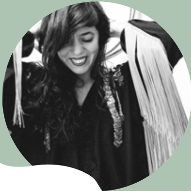
Yelli Yelli : rencontre musicale