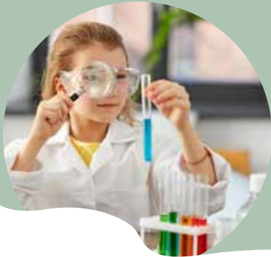
Fête de la science