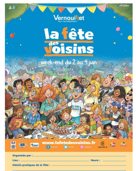
Flyer A5 pour boîtes aux lettres